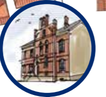
Gemeindehaus St. Servatius Haberstraße 7