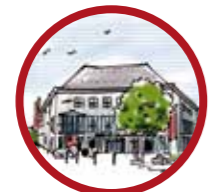
Sparkasse Duderstadt Hauptgeschäftsstelle Bahnhofstraße 41