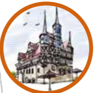
Historisches Rathaus Marktstraße 66