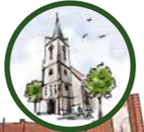
Ev. Kirche St. Servatius Marktstraße