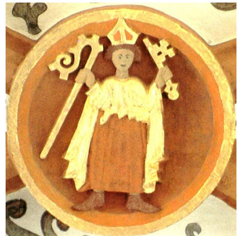
Servatius in der Oberkirche

In der St. Cyriakuskirche stehen im Chor die Schlusssteine mit Abbildungen der Heiligen: Cyriakus, Servatius und Laurentius unmittelbar einträchtig nebeneinander. Und zwar von Ost nach West in der genannten Reihenfolge. Dies sind die Heiligen der beiden Kirchen und der Stadtpatron. Noch ein weiterer Schlussstein im Mittelschiff zeigt einen heiligen St. Servatius.