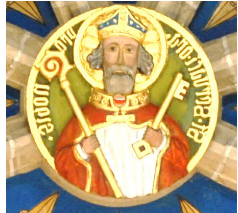
Servatius in der Unterkirche

In beiden Kirchen dominieren schön gestaltete Schlusssteine das Gewölbe. Gleich zweimal ist in der St. Servatiuskirche der heilige Servatius mit den Schlüsseln abgebildet. Einmal ganz zentral über dem Altar und noch einmal im Nordschiff.